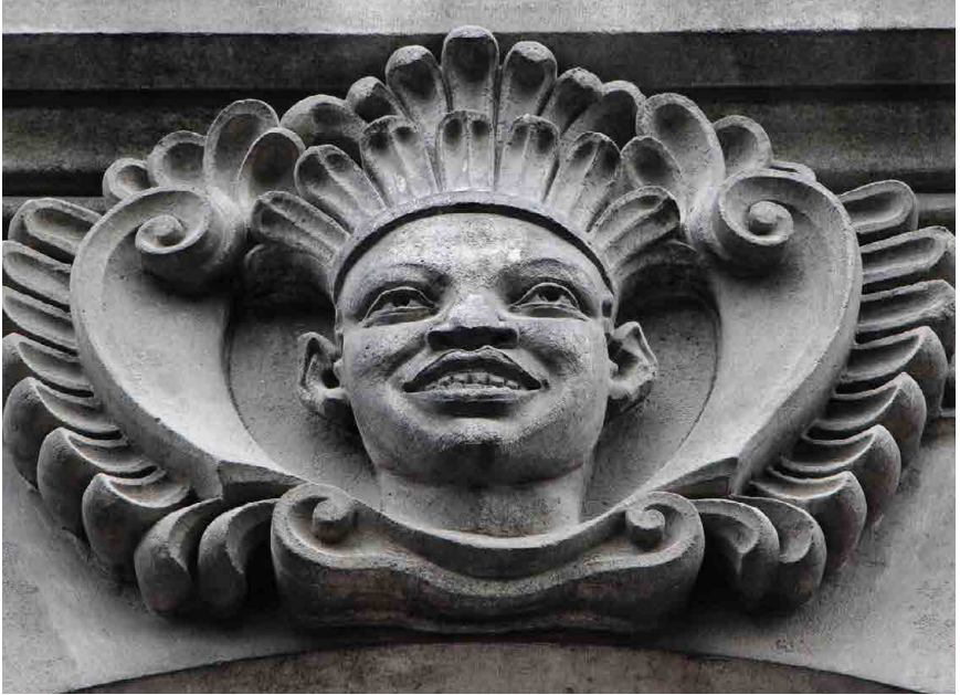
Mascaron nantais @ Anneaux de la Mémoire